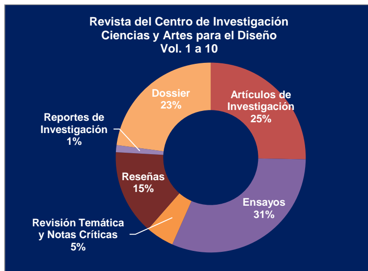
Fig. 2. Clasificación porcentual de los artículos en el área de Ciencias y Artes para el Diseño.

Las aportaciones están clasificados en artículos de investigación que representa el 25% del total, 31% son ensayos, 15% corresponde a reseñas, 5% a revisiones temáticas y notas críticas, 1% a reportes de investigación. Y en esta sección se crea (valga la palabra) la figura de un dossier que se presenta en dos ocasiones y contribuye al 23% de todo lo que se ha publicado de esta sección.