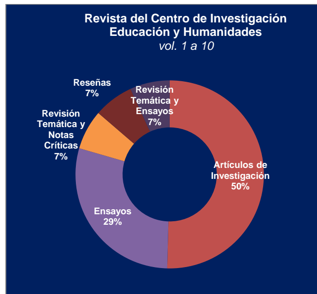
Fig. 2. Clasificación porcentual de los artículos en el área de Educación y Humanidades.

Luego también nos enfocados en la persona, sus habilidades, sus características, la calidad de la educación, así como las características de la investigación como función sustantiva de la Universidad, cuando ya era el momento de expresarlo a los 7 años de la conformación del Centro de Investigación. Estas son las características que se van perfilando en la cotidianidad del día a día en la Universidad y que perfectamente si no la conocemos se puede identificar por donde vamos para llegar hasta donde hoy nos encontramos.