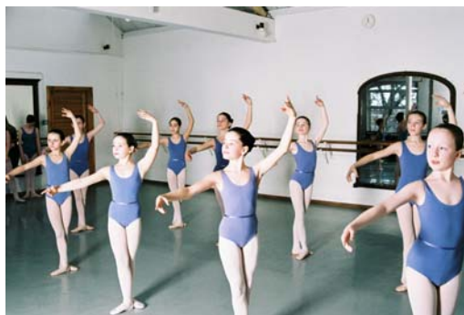
Advanced 2 y Solo Seal.

que a continuación se presenta una breve explicación de la estructura de la Royal Academy of Dance , y lo que ofrece.