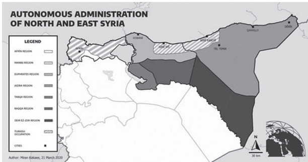
Figura 3. Las siete regiones de la Federación del Norte y Este de Siria y los territorios ocupados por Turquía

Cuando haces una revolución contra el patriarcado, contra el capitalismo, contra el Estado nacional, no puedes contar con el apoyo de otros Estados. Por eso sabíamos desde el principio que la revolución de Rojava era un paso arriesgado, pero una revolución nunca es un camino fácil. Rojava se ha preparado lo mejor que ha podido para afrontar estos días. Las fuerzas de autodefensa están preparadas e intentaremos defender este proyecto a toda costa (citado en Garrido, 2020).