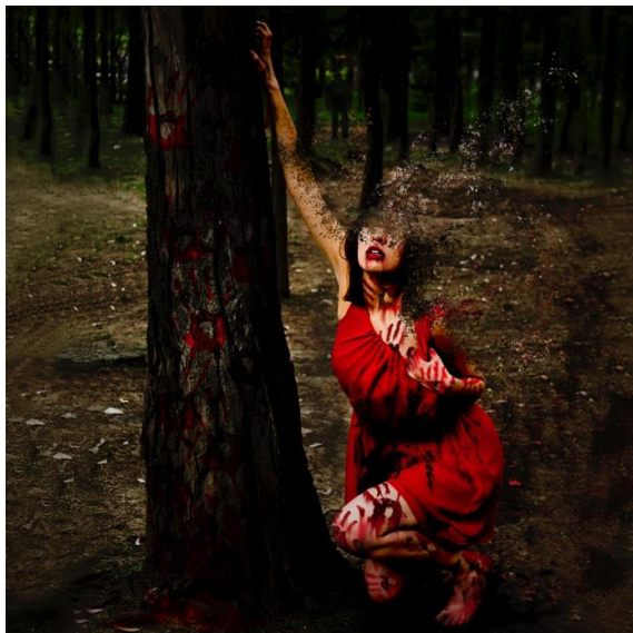
FEMINICIDIO, LUIS CRUZ, 2015

EL ESTRÉS DE LA VIDA COTIDIANA GENERA UNA ANGUSTIA EN CADA UNO DE LOS CIUDADANOS DE LA GRAN URBE, COMPRIME Y PRODUCE UN MALESTAR EN CADA SER; TODA PERSONA ANHELA DESAPARECER Y DEJAR QUE LA MENTE VUELE LIBRE SIN ATADURAS.