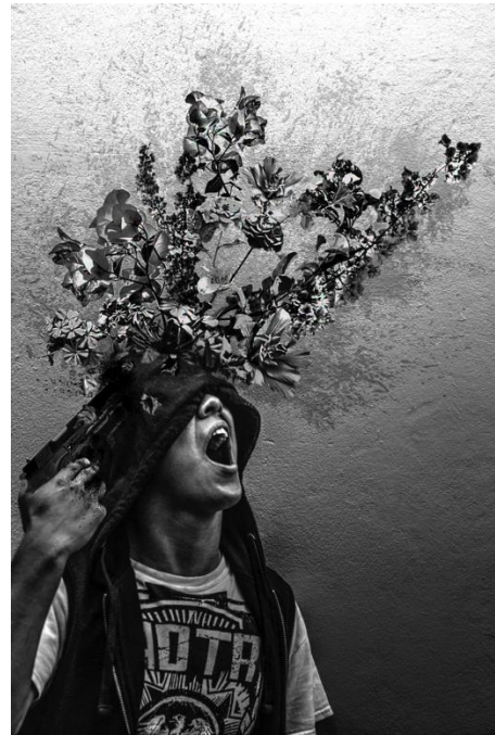
ÉXTASIS, LUIS CRUZ, 2015

MOMENTO EN EL QUE UNA PERSONA AFLIGIDA POR SUS DILEMAS ENCUENTRA REPOSO A TRAVÉS DE UNA SOLUCIÓN PERMANENTE PARA UNA ALFICCIÓN TEMPORAL, DEJANDO SU CUERPO TERRENAL Y DEJANDO SU ALMA EN LIBERTAD.