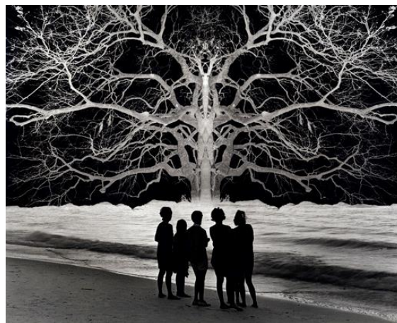
APOCALYPSE II, JERRY UELSMAN, 1967, GELATINA DE PLATA, 27.2 X 34.5 CM (10 3/4 X 13 5/8 IN), COLECCIÓN DEL ARTISTA.

The Mind's Eye: 50 Years of Photographs, Jerry Uelsmann (2013)