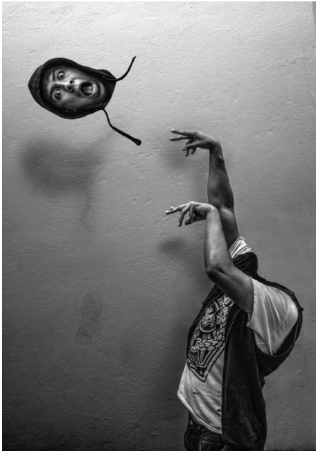
ANSIEDAD, LUIS CRUZ, 2015

EL ESTRÉS DE LA VIDA COTIDIANA GENERA UNA ANGUSTIA EN CADA UNO DE LOS CIUDADANOS DE LA GRAN URBE, COMPRIME Y PRODUCE UN MALESTAR EN CADA SER; TODA PERSONA ANHELA DESAPARECER Y DEJAR QUE LA MENTE VUELE LIBRE SIN ATADURAS.