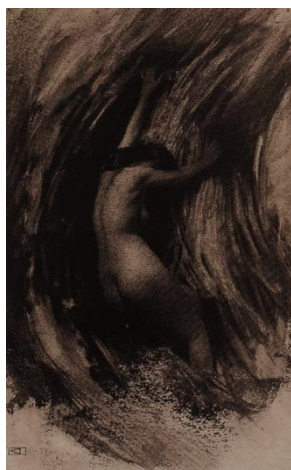
Struggle, Robert Demachy, 1904 Goma bicromatada, 17.4 x 11.6 cm (6 7/8 x 4 9/16 in.), Museo Metropolitano de Arte, Nueva York, Estados Unidos de América

A partir de 1900 con el llamado movimiento pictorialismo, cuando se formuló claramente el propósito de equiparar la fotografía a la pintura con las llamadas “impresiones nobles”. Estas transformaban el positivo en una obra única; pero el pictorialismo no iba más allá de un intento de alineación de la fotografía con la pintura. Es un lenguaje nuevo que reconoce todos los “ismos” vanguardistas, es la expresión de la modernidad, totalmente identificada con los Estados Unidos, donde destacan figuras como el alemán Stieglitz o Steichen, que supieron dar el paso para abandonar la fotografía decimonónica por una fotografía directa y libre.