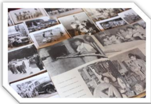
Foto 4. Fotografías en blanco y negro restauradas