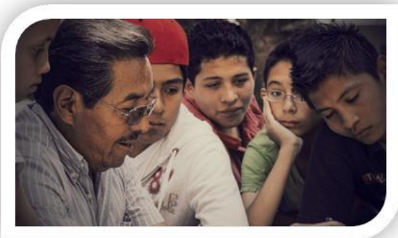
Dossier del rodaje. En ella se puede apreciar a uno de los protagonistas hablando con los niños sobre la historia del Internado y cuando él estuvo en año de 1962.