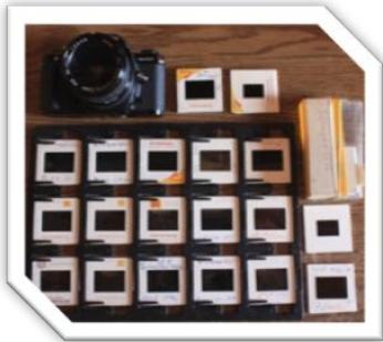
Foto 5. Transparencias tomadas en los 80's. Todo este material fue digitalizado y utilizado para el documental y la ilustración del capitulado.

Es importante saber que una vez terminado el documental la función de trabajar con un cliente real como lo es el Internado Infantil Guadalupano requiere la necesidad de continuar con este proyecto fuera y separado ya de la universidad, pues los tiempos académicos han terminado dentro de la escuela pero no con la institución y el proyecto. El documental que tiene una duración de 40 min entra dentro de la categoría del mediometrage