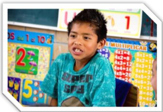
Foto 3. Un pequeño del internado infantil en las actividades recreativas que se organizan los viernes en la primaria del internado.

Este capítulo explica el modelo educativo en el que el internado infantil se basa, es la forma de trabajo y asistir a la población infantil que actualmente tiene. 1 Se define la integración social desde el ámbito educativo y social y se da prioridad a la información recabada sobre los ejes de trabajo y el perfil que se busca en los niños una vez que egresan de este hogar. Las actividades así como las áreas en las que se divide el internado son una prueba importante para demostrar la importancia en cuanto a labor social de las personas que están detrás de esta obra.