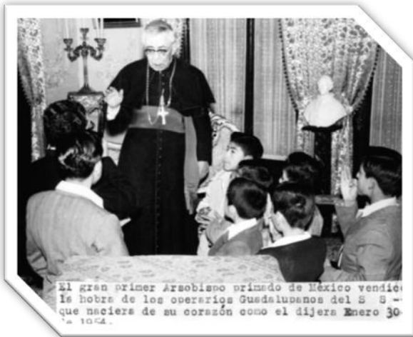
Foto 2. El primer arzobispo de la Ciudad de México: Monseñor María Martínez bendice la obra del Internado Infantil Guadalupano en enero de 1954. Siete niños y el hermano Cacho inician la obra en una casa de la colonia roma.