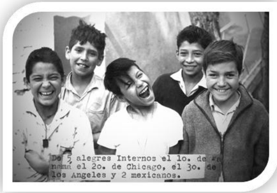
Foto 7. Fotografía restaurada. En ella se ve a niños de distintas nacionalidades que vivían en el Internado Infantil Guadalupano.