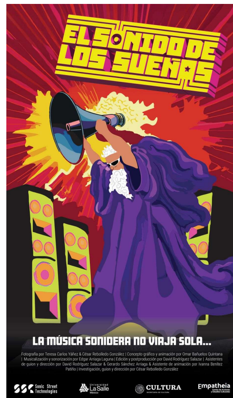
Figura 2. Póster promocional del documental “El Sonido de los Sueños”