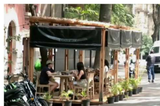
Figura 3. Enser en Estacionamiento Propio, CDMX (Universal, 2025)