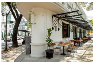
Figura 4. Enser en Banquetas, CDMX (Expansión, 2025)

*Después de seleccionar el tipo de enser a implementar, se desplegarán una serie de notas importantes que el usuario deberá considerar para saber si puede o no optar por continuar con el trámite de dicho enser en donde se proporcionará el link de la página oficial del Sistema Electrónico de Avisos y Permisos de Establecimientos Mercantiles (SIAPEM) para que el usuario pueda continuar su proceso: https://siapem.cdmx.gob.mx/ *