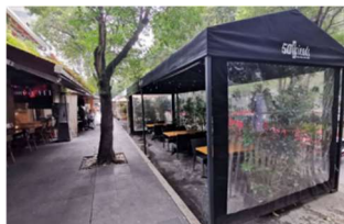
Figura 1. Enser en Arroyos vehiculares, CDMX (Heraldo, 2025)