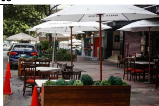
Figura 2. Enser en Franjas de estacionamiento, CDMX (Universal, 2025)