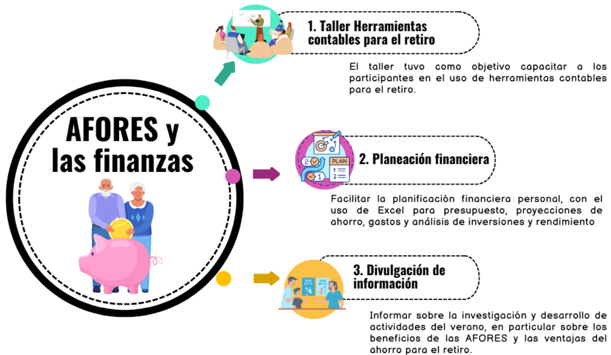
Figura 1. Resumen de productos y actividades derivadas del proyecto.

El Proyecto sigue abierto hasta conocer el efecto de la reforma del 2024 en los beneficiarios más jóvenes. En la figura 1. se pueden observar los productos generados del presente proyecto.