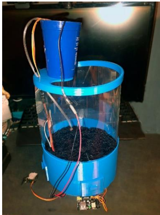
Figura 4: Sistema automatizado