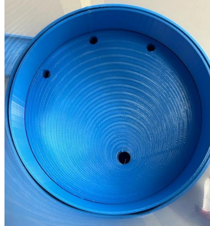
Figura 2: Vista superior del invernadero impreso en PLA