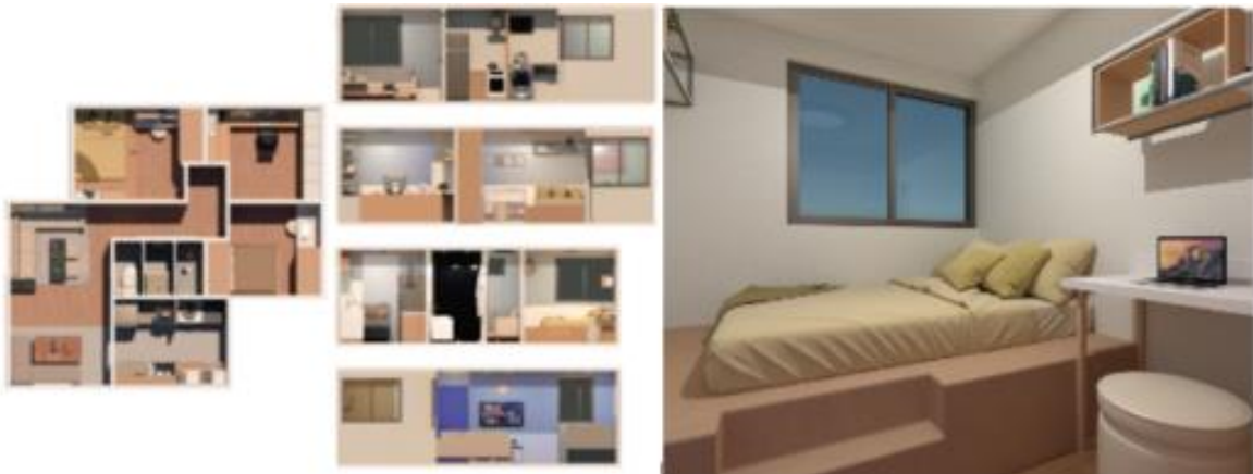
Figura 5. Propuesta de diseño para espacios interiores: Vista de la propuesta interior destacando mejoras en accesibilidad hacia zonas privadas y públicas, continuidad en el mobiliario y una estética mejorada mediante materiales y mobiliarios multifuncionales. Estos últimos permiten a los habitantes diversificar su uso, optimizando el aprovechamiento de los espacios. Elaboración propia.