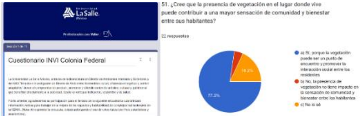
Figura 1. Cuestionario INVI, Colonia Federal: Cuestionario diseñado por estudiantes de Diseño de Ambientes Interiores y Exteriores. Este instrumento aborda diversos aspectos, incluyendo salud, seguridad, comunidad, limpieza, diseño interior y exterior, número de residentes, rango de edades, género, gustos, preferencias y necesidades, entre otros. Elaboración propia.