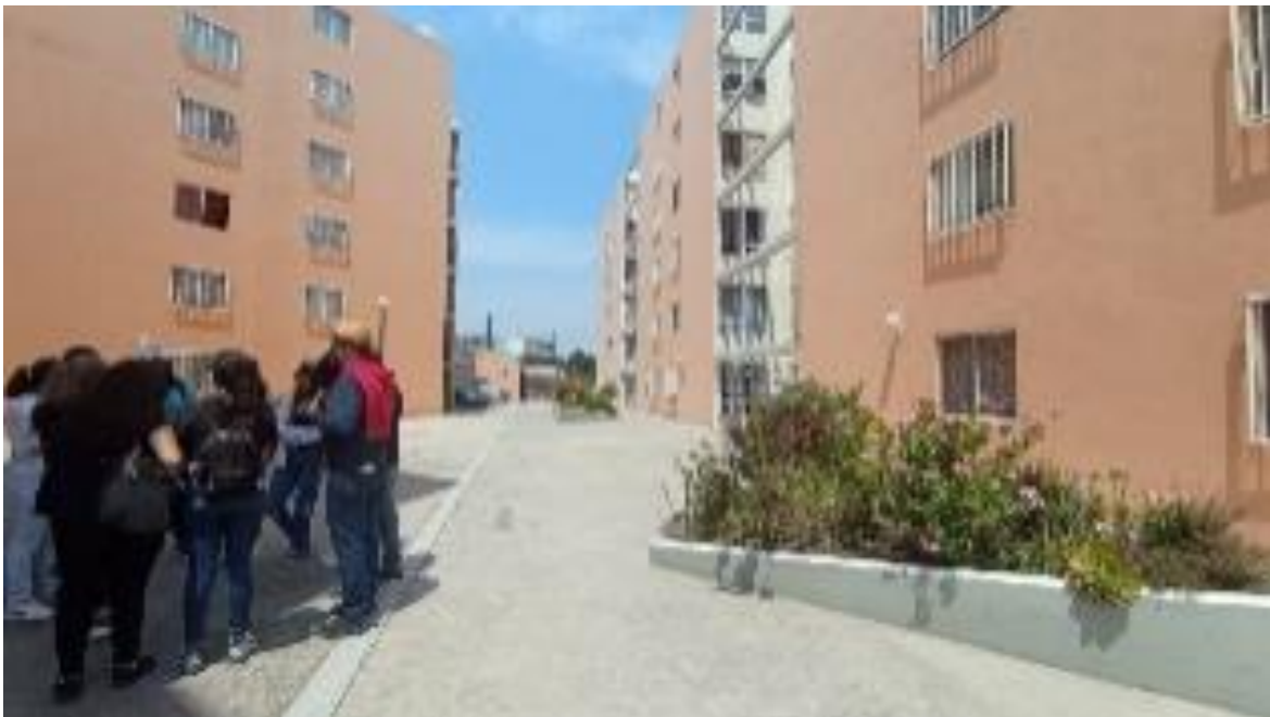
Figura 2. Recorrido por el complejo INVI: Visita realizada el 25 de marzo de 2023, guiado por la administradora del complejo. La imagen destaca la falta de vegetación y mobiliario urbano, así como la limitada interacción observada entre los vecinos. Elaboración propia.