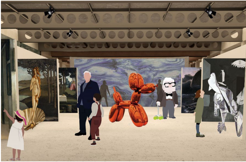
Figura 3. Visualización Galería.

El siguiente ejemplo es la galería de arte (Figura 3), diseñada para poder albergar cualquier tipo de exposición artística. Co-crear y compartir narrativas y arte es una de las formas más poderosas de interacción intergeneracional (Kratz, 2017) y este centro dedica la mayor parte de sus espacios para la aproximación al arte y la cultura de forma interdisciplinaria. Este tipo de espacios flexibles, permiten que la vida dentro