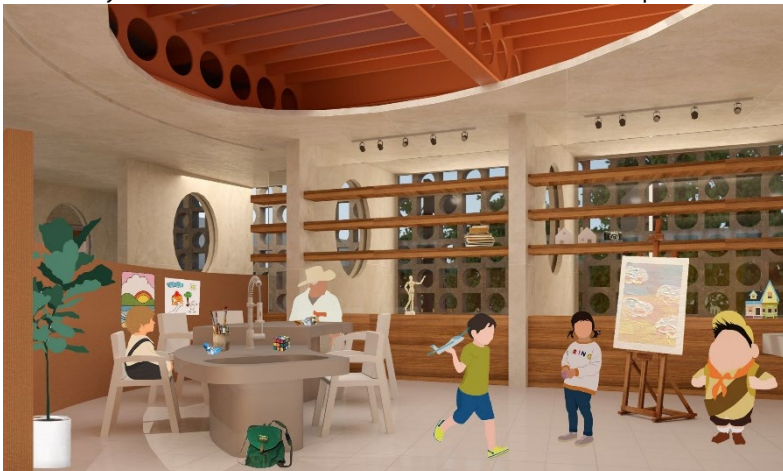
Figura 2. Visualización Laboratorio de arte.

Un ejemplo es el Laboratorio de Artes (Figura 2). En este podemos ver cómo interactúa la estructura y la textura de los materiales con elementos que son a su vez decorativos y funcionales.