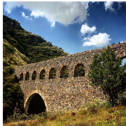
Imagen 2. Acueducto de San Francisco, Barrio Camelia.

La Ruta Arqueológica Minera (RAM) es un sistema urbano multidimensional que, mediante el aprovechamiento del patrimonio cultural, las posibilidades endógenas y recursos locales, contribuirá al desarrollo de economías urbanas, dinámicas, sostenibles e inclusivas, para dar a conocer el proyecto y lograr una conexión con el público, se aplicarán las siguientes estrategias: