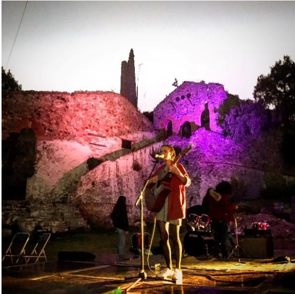
Imagen 3. Evento Cultural En Mina Camelia, Barrio Camelia.

-Feria Universitaria del Libro, de la Universidad Autónoma del Estado de Hidalgo (FUL). -Todos los eventos relacionados con cultura y turismo en gobierno estatal y municipal.