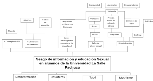
Figura 1. Árbol del problema

A continuación, se muestra el árbol del problema, el cual tiene una estructura vertical, que permite una lectura ascendente. Las causas de encuentran en la parte inferior, el problema en el centro y las consecuencias en la parte superior.