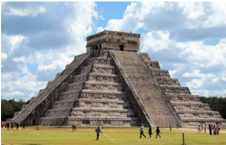
Imagen 9. Monumentalidad en Chichen Itzá