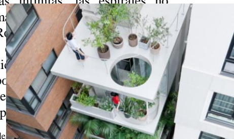
Imagen 5. Fotografía interior de un edificio donde se observan las circulaciones y rampas. Imagen 6. Fotografía exterior de la Casa Jardín, ubicada entre dos edificios, imagen obtenida de https://www.designboom.com/a/the-kunsthal-in-rotterdam-02-1/ y https://www.australiandesignreview.com/architecture/gardens-renovates-the-kunsthal-in-rotterdam-02-1/

Adicional a lo mencionado anteriormente, es importante decir que en las arquitecturas infinitas las espirales no siempre tienen que ser con forma de rampa. Un ejemplo es el museo de arte Kunsthal en Rotterdam, diseñado por Renzo van Koolhaas cuando trabajaba en OMA. El edificio demuestra cómo tener la tectónica de un volumen regular, lográndolo por medio de una rampa que genera de esta manera una gran sensación de movimiento y a la circulación y relación de esp