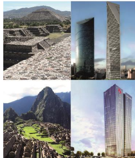
Imagen 8. Comparación de edificaciones antiguas y actuales entre México y Perú, imágenes obtenidas de

Adicional a esto, y contestando las preguntas planteadas al inicio de este capítulo, nos damos cuenta de que conforme se