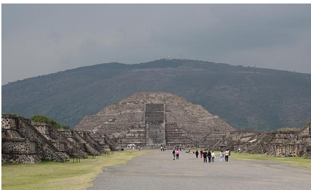
Imagen 10. Fotografía en donde se observa el juego de escalas entre lo natural (Cerro Gordo), lo arquitectónico y el humano, imagen obtenida de https://www.flickr.com/photos/67769030@N07/20660408766