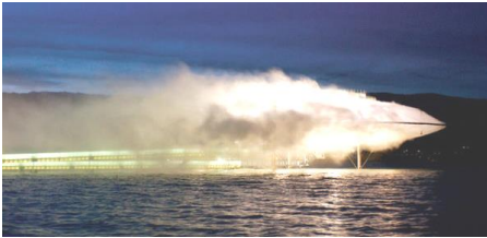
Imagen 7. Pabellón "Blur Building", en donde se observa lo efímero de esta arquitectura, imagen obtenida de https://www.atlasobscura.com/places/blur-building-architecture

La casa jardín vertical que desarrolló Ryue Nishizawa, perteneciente a la firma SANAA, es otro ejemplo de arquitectura fugaz, ya que, en la fase proyectual, siempre se tuvo en cuenta que la casa no iba a ser eterna debido a las condiciones en las que se vive en Japón con respecto a los desastres naturales, lo cual permitió que se tuviera una más amplia experimentación de materiales, de espacios, de circulaciones y de relación con el exterior; lo cual es evidente ya que, a diferencia de una casa convencional, ésta posee una fachada que cambia con el tiempo gracias al conjunto de plantas que la conforman, además de que tiene espacios abiertos y relacionados entre sí por medio de vanos en muros o en losas, cargando así a este proyecto de una gran riqueza tectónica a través de la fugacidad de la construcción.