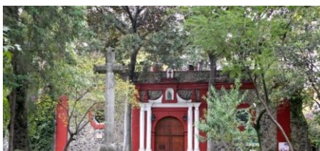
Imagen 11. Fotografía en donde se aprecia la relación del exterior con el interior de una capilla abierta aislada

con el exterior ya que uno no podía ser sin el otro.