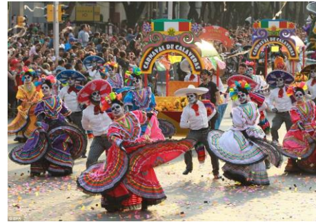
Imagen 12. Fotografía del desfile de Día de Muertos del 2017 en la CDMX, en donde se capta la capacidad de generar comunidad, imagen obtenida de http://www.dailymail.co.uk/news/article-5029219/Thousands-celebrate-Day-Dead-Mexico-City-parade.html