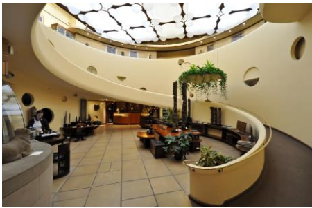
Imagen 1. Morris Gift Shop de Frank Lloyd Wright

Dada la complejidad del estudio propuesto, se ha seleccionado una forma de estudiar la evolución de la tectónica, que es a través de las geometrías infinitas, es decir, de las espirales y su relación con los proyectos arquitectónicos. En este tema uno de los representantes es Frank Lloyd Wright, ya que proponía nuevas formas de entender y plasmar los espacios, como se puede apreciar con la mesa que fija al piso en la Casa Lloyd Lewis, ubicada en Illinois, EUA, para pasar de la sala de estar a la cocina, dividiendo dos espacios sin la necesidad de recurrir a la solución más obvia que sería un muro, en otras palabras, hace una propuesta fuera de lo cotidiano en aquella época sobre cómo dividir un espacio, desafiando los límites de la tectónica. Probablemente el elemento que define en muchas ocasiones la arquitectura de Wright y que le concede ese gran poder tectónico que tiene, es la rampa, debido a que a través de ella puede realizar experimentaciones espaciales, vivenciales y de circulación, como por ejemplo, en la Morris Gift Shop en San Francisco, en donde el interior de la tienda nos da una vivencia dinámica a través de las formas circulares y continuas que se utilizan, dando un gran valor y potencial formal y tectónico, porque propone y soluciona maneras poco convencionales de circular a través del edificio.