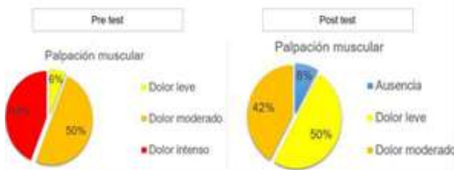
Figura 6. Comparación Pre test y Post test de prueba palpación muscular.

La siguiente prueba es palpación muscular.