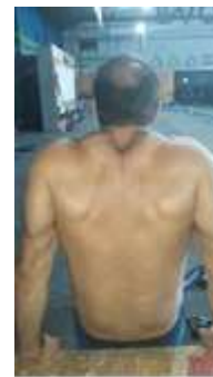
Figura 4. Tercer ejercicio.

El tercer ejercicio es una variación de fondo, consiste en apoyar las manos en un cajón manteniendo la posición de fondo con el talón apoyado sobre el suelo, a continuación realizar descensos con el cuerpo sin cambiar la posición de los brazos.