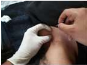
Figura 1. Punción seca

Se utilizaron agujas filiformes de plata con una longitud de 0.50 mm y diámetro de 0.30 mm. Además, el procedimiento se realizó con guantes estériles y la región desinfectada.