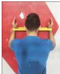
Figura 2. Primer ejercicio.

El primero consiste en realizar aperturas con banda elástica sobre la pared, manteniendo un ángulo de 90° utilizando una banda elástica amarilla, la cual tiene una resistencia mínima, que estirada al 100% equivale a una resistencia de 1.3 kilos.